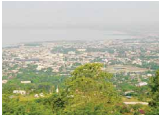
Ciudad de Bujumbura - Burundi