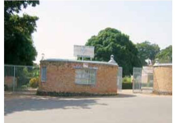
Entrada de la "High School de St Esprit"