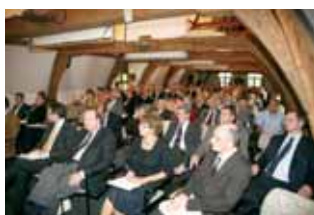
El encuentro - Amberes Bélgica Mayo de 2008.