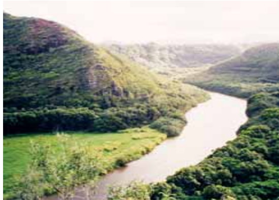
Uno de los ríos de Burundi