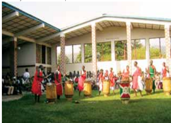
Grupo de estudiantes bailando - "St Esprit High School"