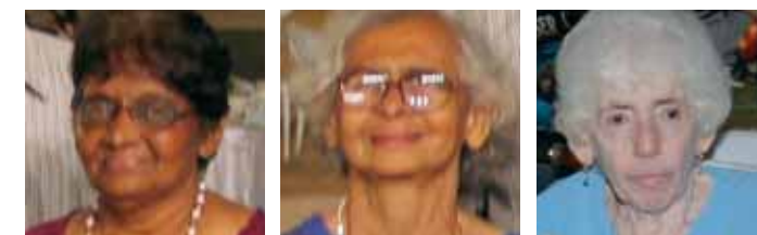
Leyenda de las fotos:

Estoy asombrado viendo cuanto puede realizar nuestra organización de antiguos alumnos cuando trabajamos colectivamente. Nuestros profesores ahora tienen una vida tranquila y digna y nunca se quejaron de lo poco que habían recibido por una vida entera de servicio. Estoy realmente maravillado al ver que un pequeño esfuerzo de los antiguos alumnos haya tenido un impacto tan grande en la vida de nuestros profesores.