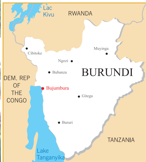
Bujumbura - Ubicación geográfica.

Organizado por la Asociación de Burundi de Antiguos Alumnos de Jesuitas (ABAJ) con el concurso de los Antiguos/as Alumnos de la República Democrática del Congo y de Ruanda