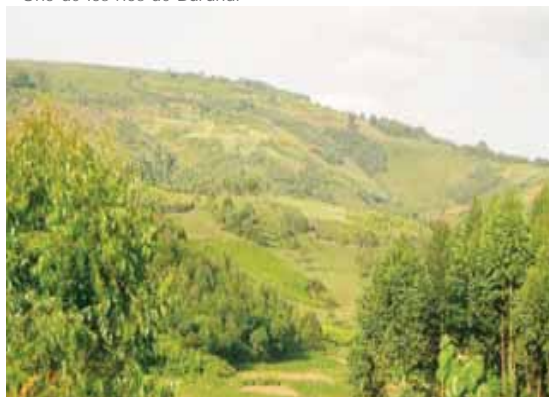
Paisaje de Burundi "el país de las mil colinas"