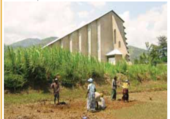
Capilla de la "High School de St Esprit"