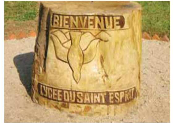
Escultura de piedra del blasón de la escuela